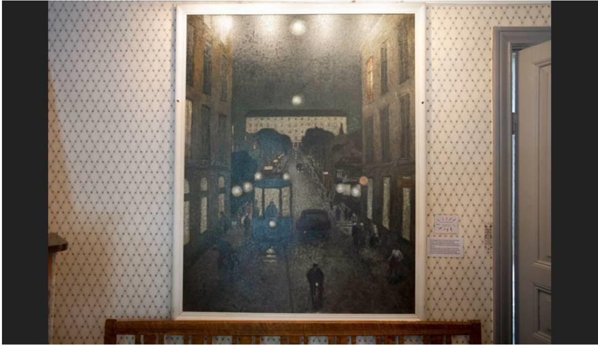
BILD: Sven-Olof Ahlgren | Sven Lofströms oljemålning av Drottninggatan i Uppsala som den såg ut förr.

Föreningens inkomster kommer från uthyrning av husen och valven under till privata fester av alla de slag.