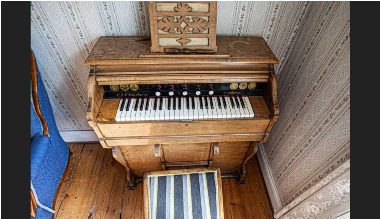
Orgel står på övervåningen i rättargården, bredvid en soffa som ägts av Nathan Söderblom.

– När de fina gästerna närmade sig prästgården undrade de säkert hur Nathan Söderblom kunde bo i detta blygsamma hus.