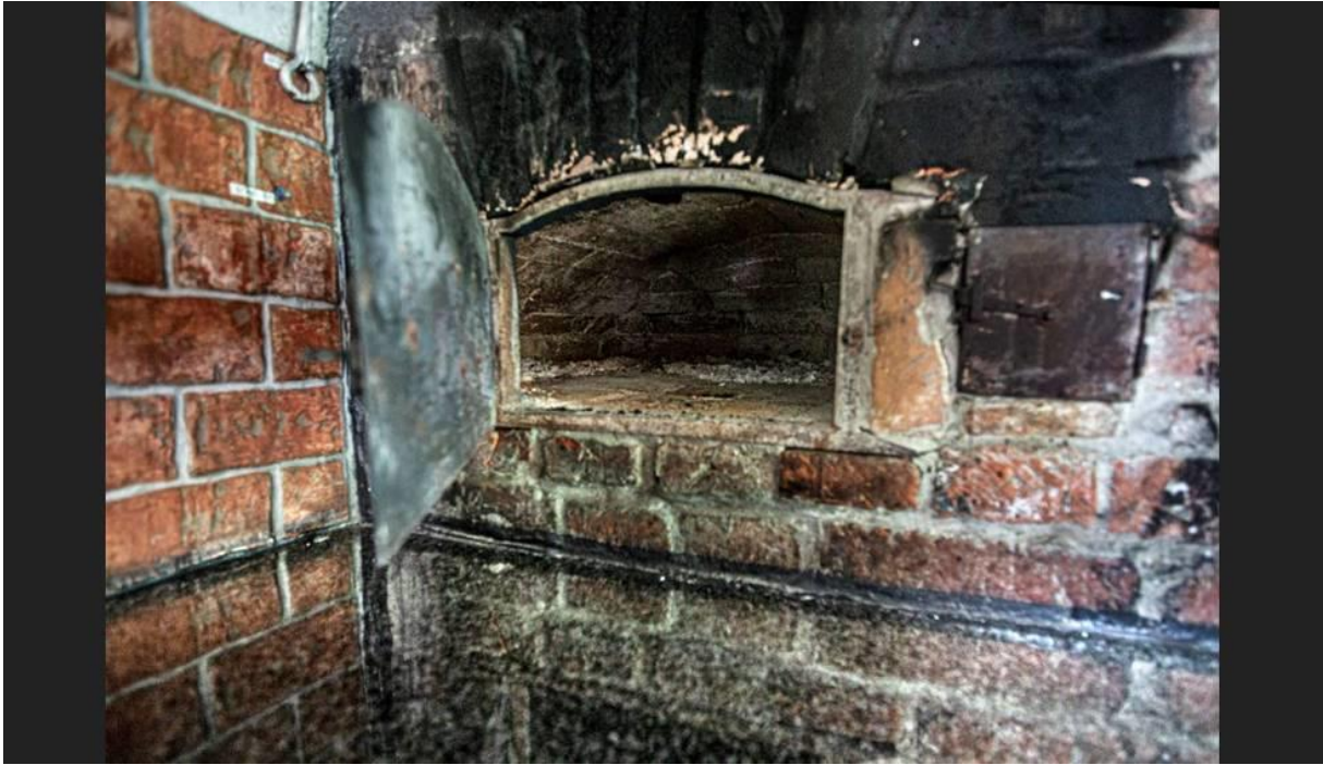
I bakungen i köket på rättargården bakas det rågbröd varje höst.

Hon berättar att här har funnits ett boställe för präster sedan 1500-talet.