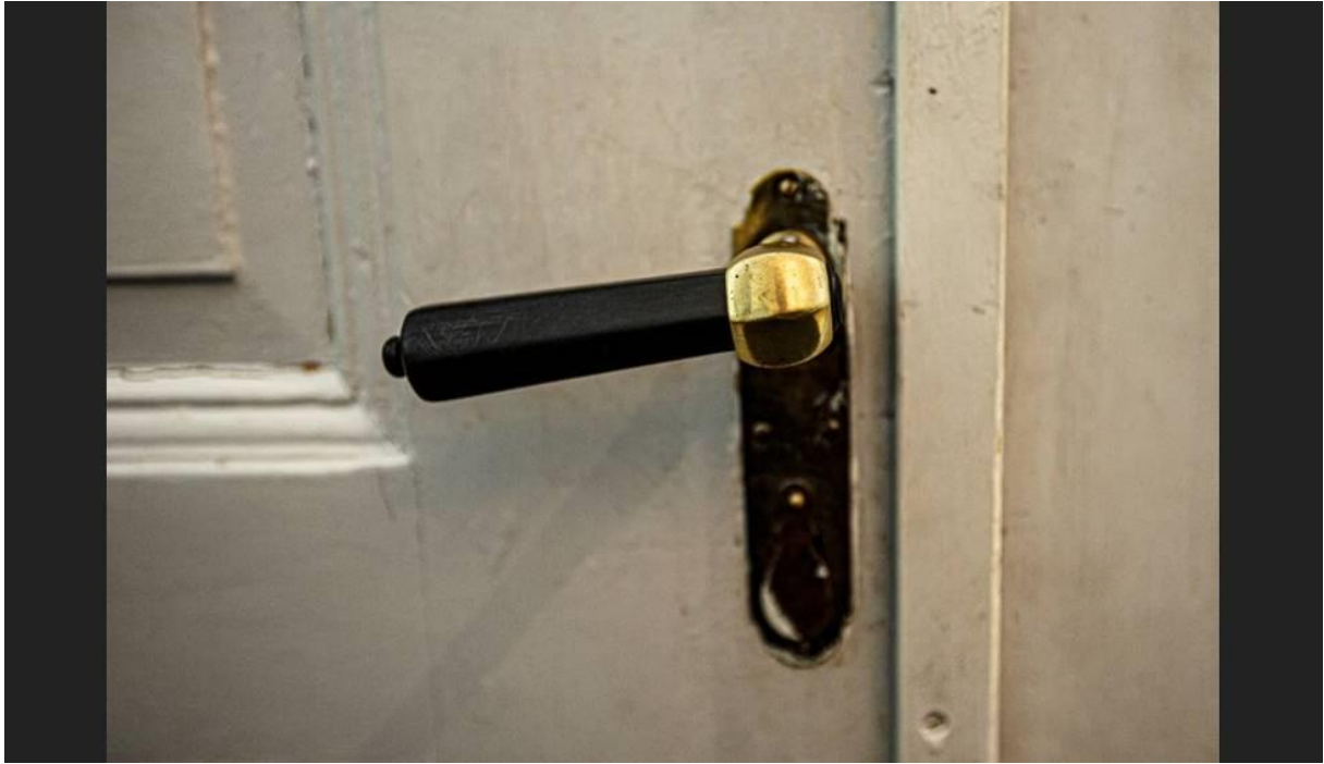
Dörrhantagen i rättargården är original från när huset byggdes 1869.

Nathan Söderblom hade internationella kontakter och tidens kända filosofer och teologer tog han emot i det han kallade "Stabbystugan".