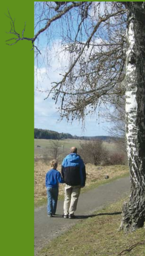
Produktion: Fritids- och naturkontoret i samarbete med Informationsservice, Uppsala kommun 2008. 276815